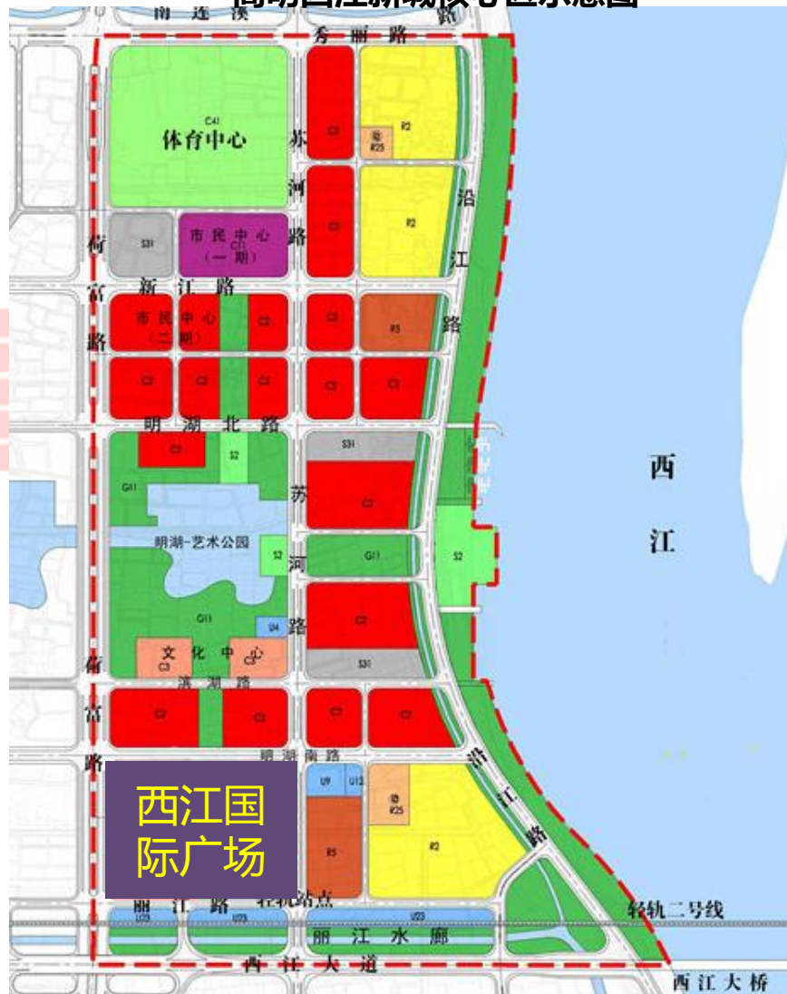
高明西江新城核心区示意图

高明欲将这座现代化大型城市商业综合体打造成区域性商业中心，项目建设集主题百货、数码广场、超市卖场、特色商业街区、特色餐饮、国际电影院线、动漫电玩城、写字楼、公寓、高层住宅等配套设施等物业。按协议，开发商将会引入世界零售业50强、全球快餐连锁业20强及全球知名服装时尚品牌等进入。