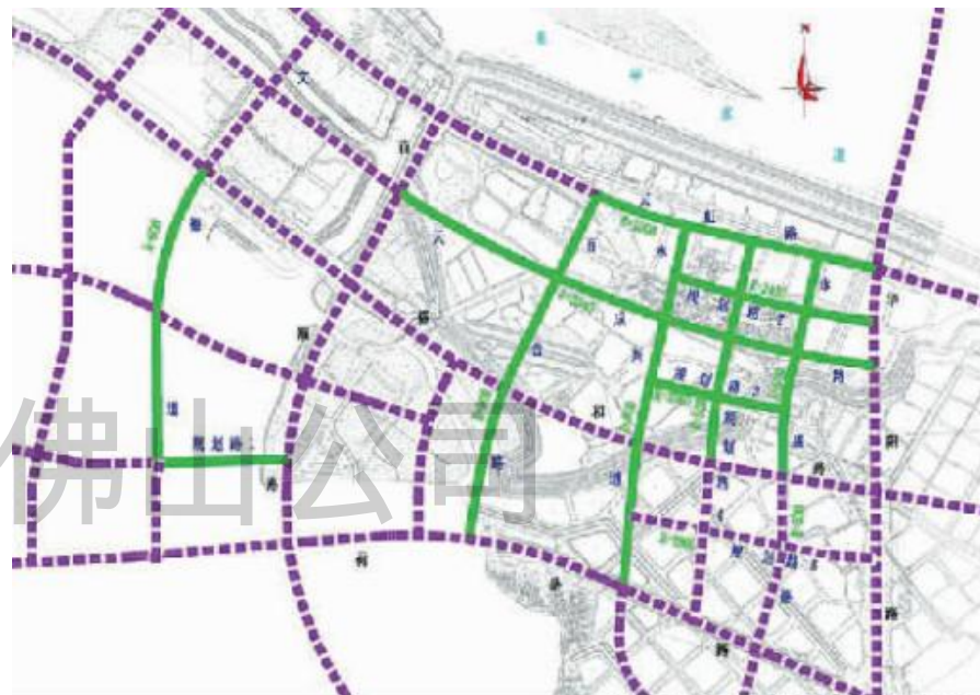
佛山新城 CBD 二期周边路网建设示意图

——点评：新城建设要实现“东西南北辐射”；“东进”向陈村、北滘和顺德中心城区靠拢，与顺德新城实现“双核带动”、比翼齐飞之势；“南拓”朝一环方向，开拓新城广阔发展空间；“北接”对接禅城老城区；“西联”向南庄、西樵及高明加强联动，在产业等方面加强辐射。其中，“南拓”布局最为核心，由北向南朝荷岳路、三乐路、佛山一环方向梯次推进，稳步南拓。CBD 二期周边路网的建设，无疑为这“三线战略”走出了关键一步。